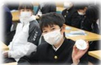
東谷中学校との交流