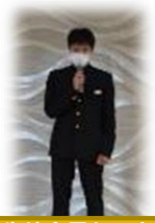
生徒会長あいさつ