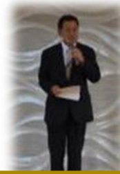
校長先生あいさつ

10/22（土）に学習フェスタが開催されました。合唱コンクールでは、各クラス一丸となった素晴らしい歌声が体育館に響き渡りました。さらに吹奏楽部の演奏、有志による歌の披露、英語暗唱発表、加えて校舎でたくさんの作品展など、まさに「百花繚乱」な学習フェスタとなりました。