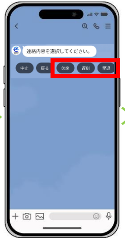
欠席・遅刻・早退を選択