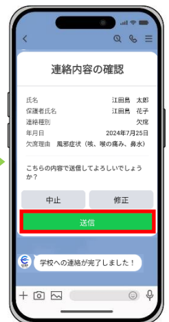
連絡内容の確認、送信