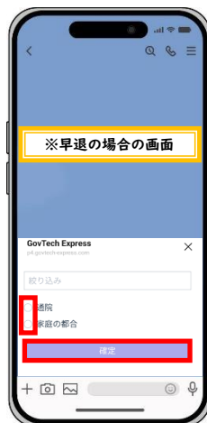
早退する主な理由の選択（一つのみ）