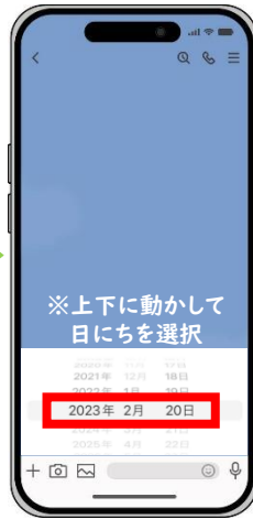
※ iPhoneの場合 該当する日にちを選択