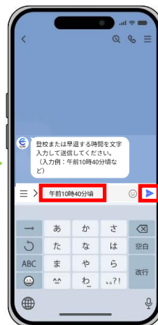
遅刻または早退する時刻を入力して送信 （遅刻・早退のみ）