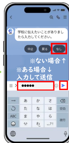
学校への連絡事項の有無