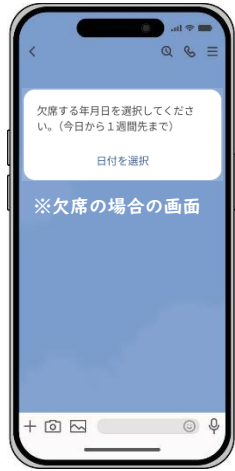
欠席・遅刻・早退する日にちを選択