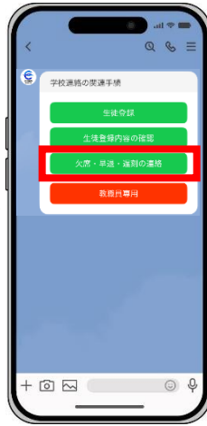
「欠席・早退・遅刻の連絡」を押す