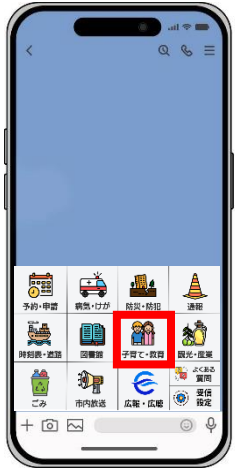
メニューの「子育て・教育」を押す

LINEによる欠席等の連絡は、午後6時～翌朝8時5分のみ受付可能です。 上記以外の時間は電話で連絡をしてください。