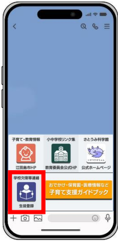
「学校欠席等連絡 生徒登録」を押す