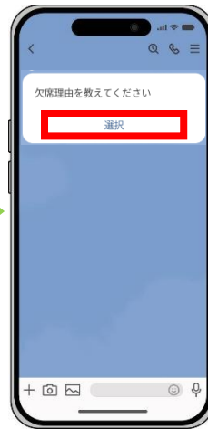
欠席する理由を選択