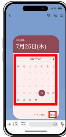
※ Androidの場合 該当する日にちを選択