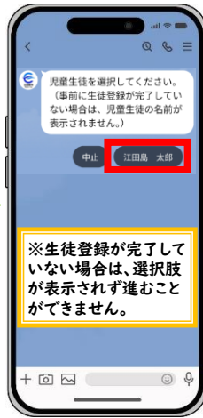
事前に登録した生徒を選択