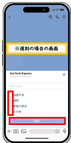
遅刻する主な理由の選択（一つのみ）