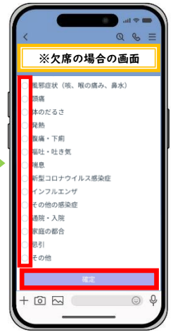
欠席する主な理由の選択（一つのみ）